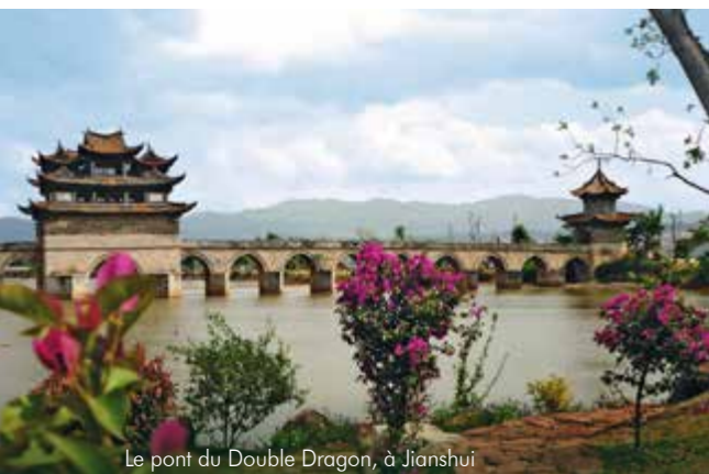
Le pont du Double Dragon, à Jianshui