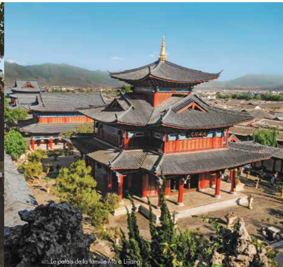
Le palais de la famille Mu à Lijiang