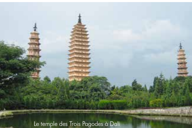
Le temple des Trois Pagodes à Dali