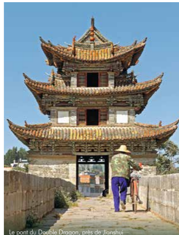
Le pont du Double Dragon, près de Jianshui