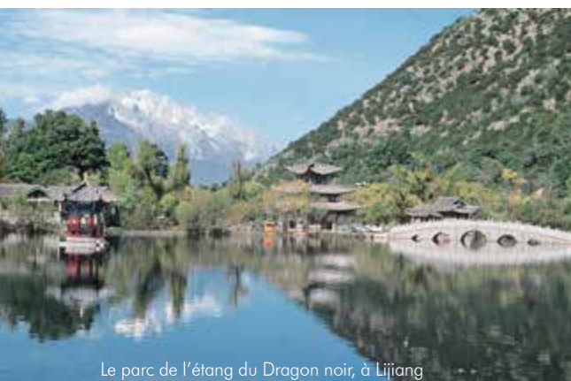
Le parc de l'étang du Dragon noir, à Lijiang