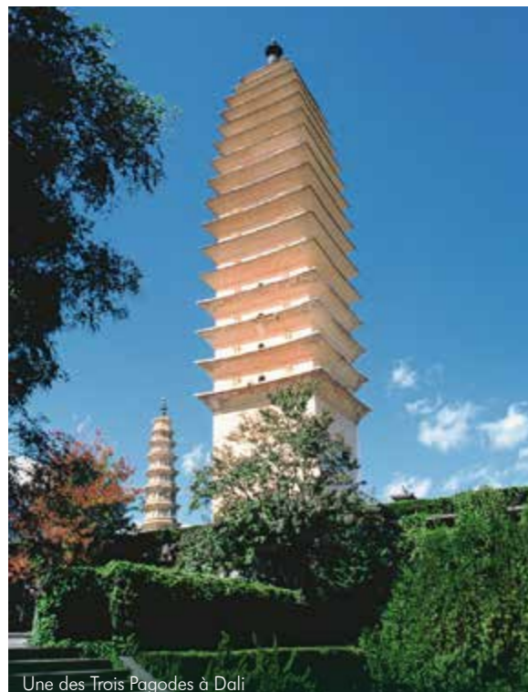
Une des Trois Pagodes à Dali