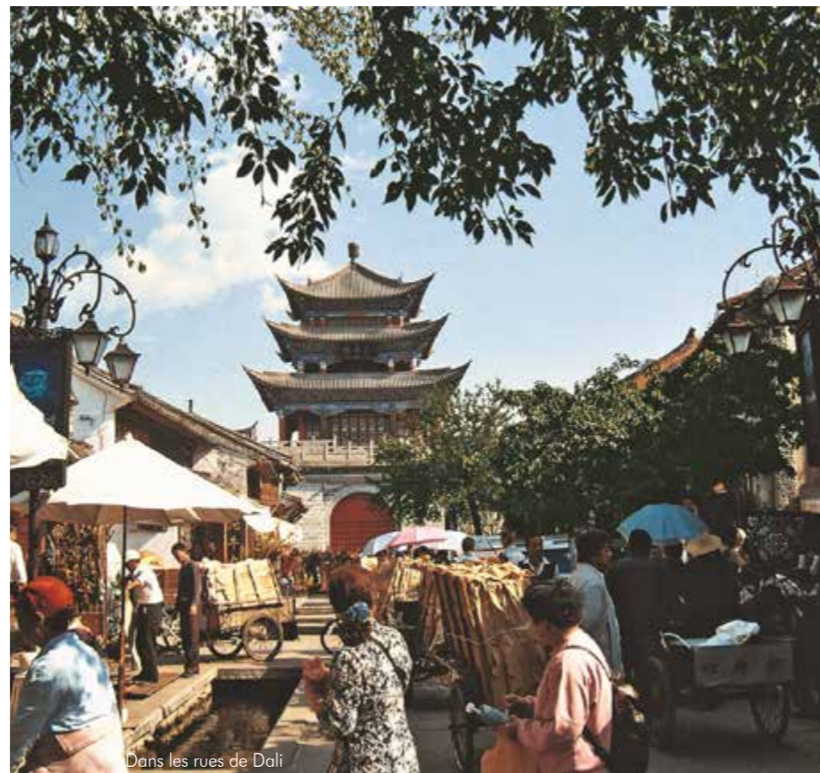
Dans les rues de Dali