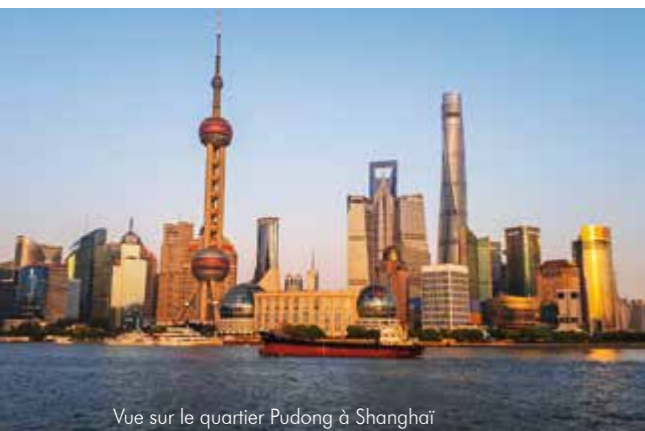
Vue sur le quartier Pudong à Shanghai