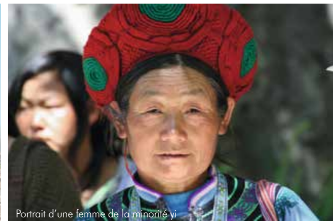
Portrait d'une femme de la minorité yi