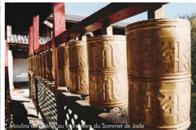
Moulins de prières au monastère du Sommet de Jade