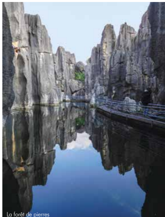
La forêt de pierres