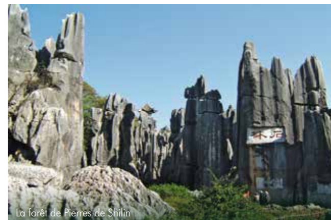
La forêt de Pierres de Shilin