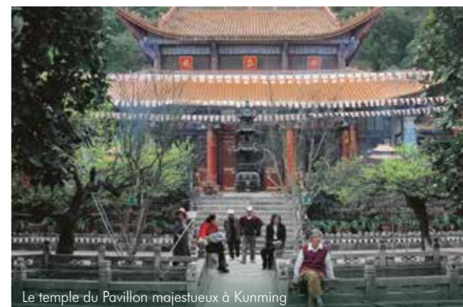
Le temple du Pavillon majestueux à Kunming

des stalagmites géantes. Résultat de millions d'années d'érosion, ces formations géologiques s'étendent sur 400 kilomètres carrés ! À travers les chemins et les sentiers, préparez-vous à être transporté dans un monde de magie et d'émerveillement.