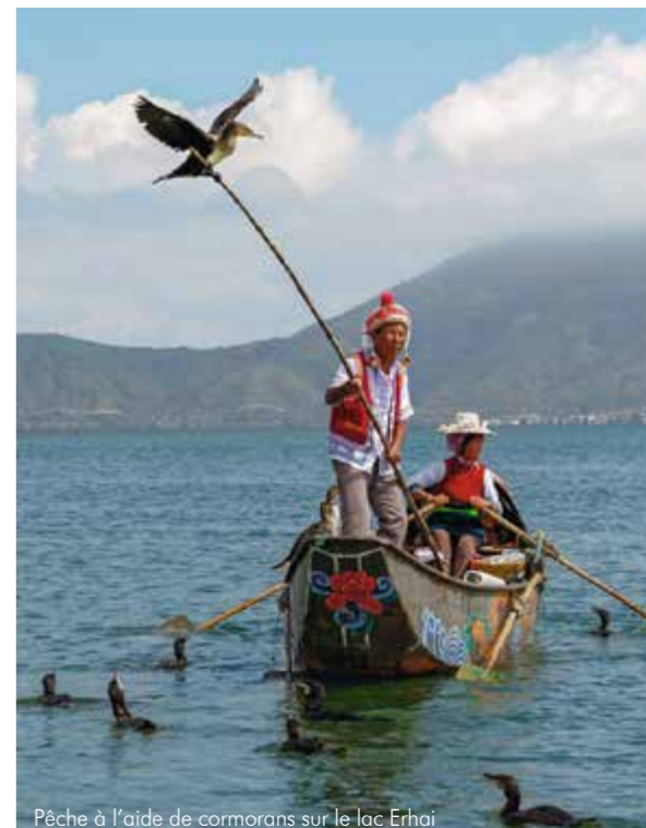
Pêche à l'aide de cormorans sur le lac Erhai